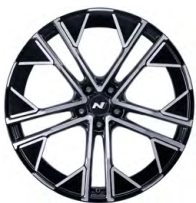
21" kovaná kola z lehké slitiny

www.porovnejhyundai.cz (Porovnejte si vozy Hyundai s konkurencí)