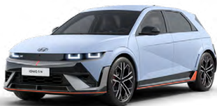
Performance Blue Matná metalická Cena: 24 900 Kč