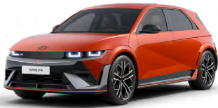
Soultronic Orange Perleťová Cena: 0 Kč