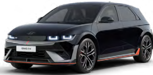
Abbys Black Pearl Perleťová Cena: 19 900 Kč