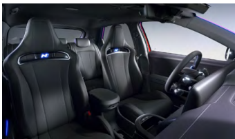
Černý interiér – čalounění sedadel kůže/látka – dostupné pro N