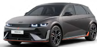
Ecotronic Gray Matná metalická Cena: 24 900 Kč