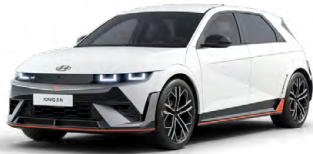
Atlas White Speciální pastelová Cena: 11 900 Kč