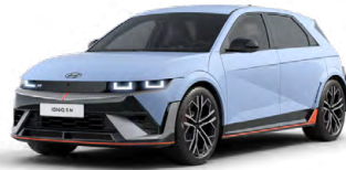
Performance Blue Pastelová Cena: 19 900 Kč