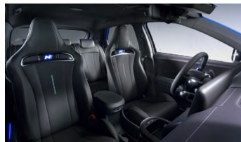
Černý interiér – čalounění sedadel Alcantara/ kůže – dostupné pro N Everyday