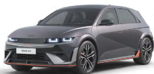
Ecotronic Gray Perleťová Cena: 19 900 Kč