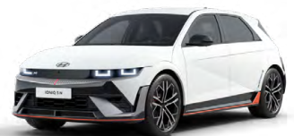
Atlas White Matná metalická Cena: 24 900 Kč