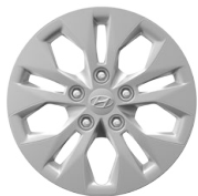
15" ocelová kola s celoplošnými kryty