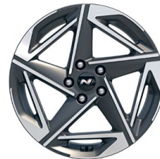
18" kola z lehké slitiny – N Line

www.porovnejhyundai.cz (Porovnejte si vozy Hyundai s konkurencí)