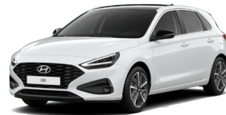
Serenity White Pearl Perleťová Cena: 16 900 Kč