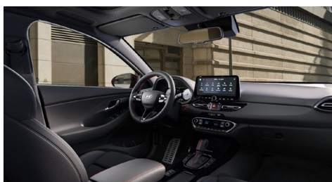
Černý interiér N line Premium – prémiové čalounění v kombinaci kůže/semiš – černé čalounění stropu a obložení bočních sloupků – červeně prošívání sportovní volant, hlavice řadící páky a loketní opěrka