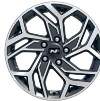
17" kola z lehké slitiny – N Line