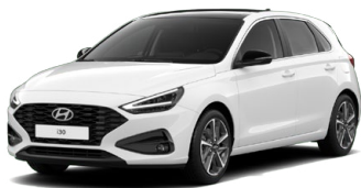
Atlas White Pastelová Cena: 5 900 Kč