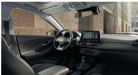
Černý interiér Oceanidis Black Premium – kožené čalounění sedadel – černé čalounění stropu a obložení bočních sloupků – světlé čalounění stropu a obložení bočních sloupků – černé provedení přístrojové desky a výplní dveří