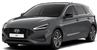
Ecotronic Gray Pearl Perleťová Cena: 16 900 Kč