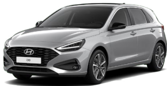
Shimmering Silver Metallic Metalická Cena: 16 900 Kč