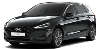
Abyss Black Pearl Perleťová Cena: 16 900 Kč