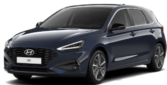
Sailing Blue Pearl Perleťová Cena: 16 900 Kč