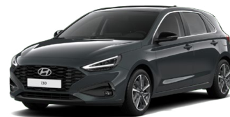
Cypress Green Pearl Perleťová Cena: 16 900 Kč