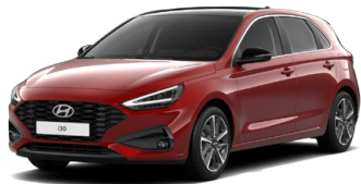
Ultimate Red Metallic Metalická Cena: 16 900 Kč