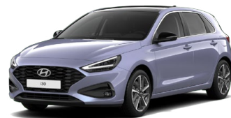
Meta Blue Pearl Perleťová Cena: 16 900 Kč