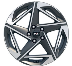
18" kola z lehké slitiny – N Line

www.porovnejhyundai.cz (Porovnejte si vozy Hyundai s konkurencí)