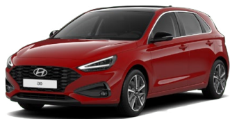
Engine Red Pastelová Cena: 0 Kč